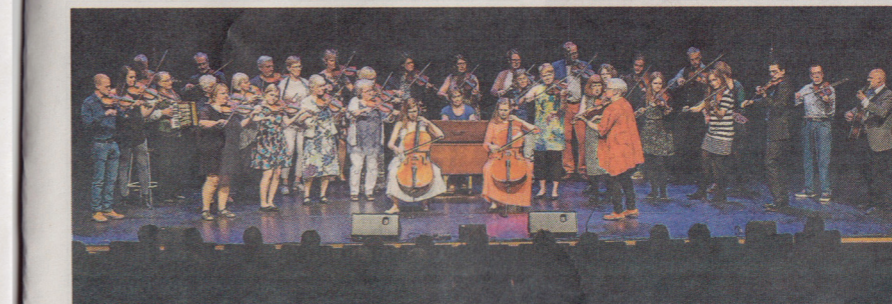
Ålandfolk inledde med en "Vals från Kumlinge".