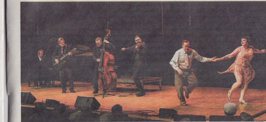
Mildreds swingskola dansade till Whatclub och Vladimir Shafraanovs musik.