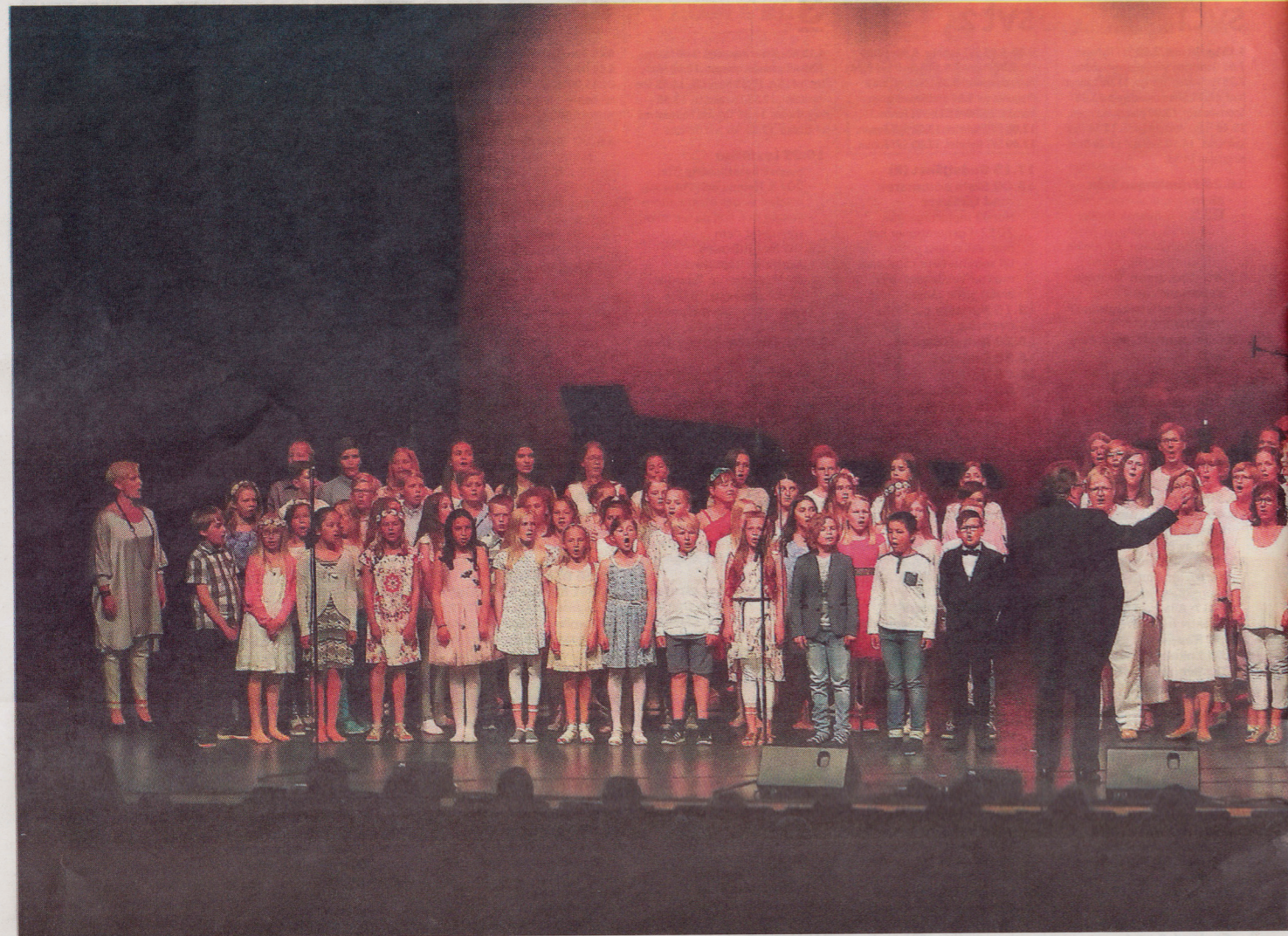
I jubileumskören sjöng Magnificat, Mariehamns Kvartetten och en barnkör från Strandnäs skola.